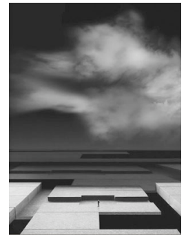
Prima del giorno #14, 2007

La galleria Amy-d arte spazio in occasione del Photofestival di Milano espone dal 14 Marzo al 05 Aprile 2013 le opere di Franco Donaggio.