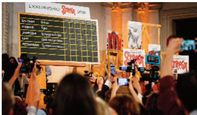
Premio Strega. Lo scrutinio dei volti con la classifica dei vincitori

zionaria anche da un altro punto di vista: rompe il 'dominio' sul Premio Strega, ininterrotto da oltre trent'anni, delle grandi case editrici Mondadori, Rizzoli, Einaudi. Il libro, come spiega la stessa autrice, è la biografia di "una donna libera e indipendente",